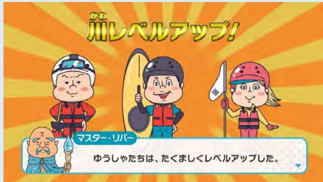
リバーアドベンチャー ～川に見せられしものたち～ 児童向けの水難事故防止アニメーション動画 (国土交通省)